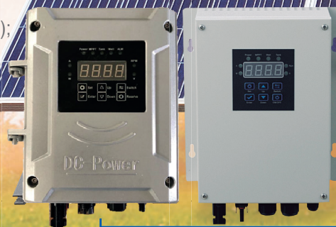
Controlador Externo (ce)